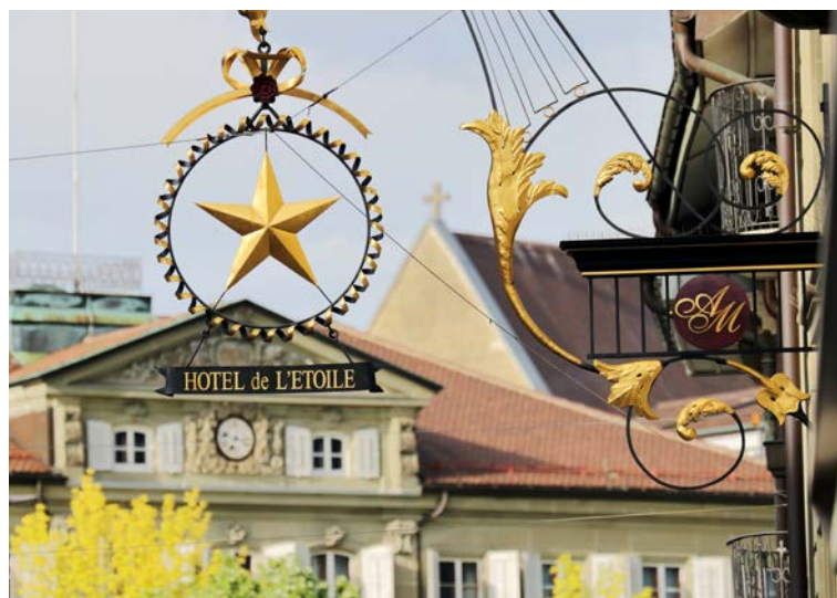
Il y a bien longtemps qu'il n'existe plus d'Hôtel de l'Étoile à la rue de Romont. En revanche, l'enseigne de l'établissement, une des plus imposantes que compte la ville, orne toujours la façade.

Déjà visibles sur le célèbre plan Martini de 1606, ces repères revêtaient