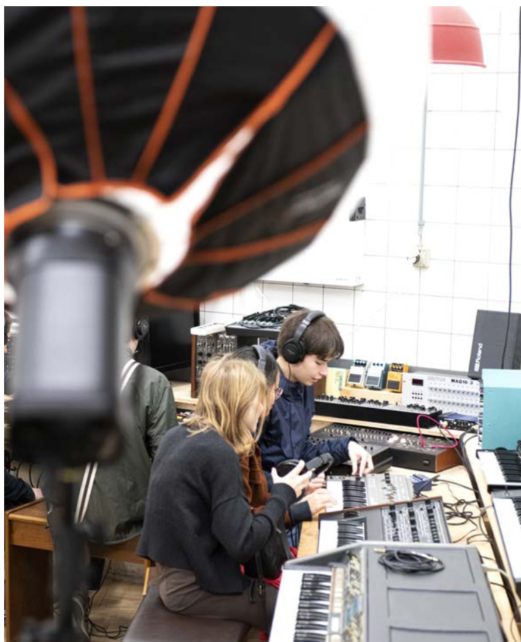
Lors de l'édition 2022, les nouveaux majoritaires ont pu tester divers instruments du SMEM (swiss museum for electronic music)

A voir 18 ans, ça se fête. Du jour au lendemain, on a le droit de vote, on est éligible, on peut entrer en boîte, conduire une voiture et même se marier ! Être enfin considéré comme un adulte, c'est pour beaucoup une fierté. Mais, être adulte, c'est aussi être responsable civilement, remplir sa première déclaration d'impôt et, pour les hommes, voir l'armée ou le service civil pointer le bout de son nez. Alors, parce qu'avoir 18 ans est l'un des plus grands tournants de la vie, la Ville de Fribourg invite officiellement ses majoritaires à une réception le 15 novembre au Nouveau Monde. Les heureux et heureuses élus-es profiteront d'un apéritif dînatoire, d'animations et rencontreront le Conseil communal au grand complet. Cerise sur le gâteau : l'entrée gratuite à la soirée festive du Nouveau Monde. Si le carton d'invitation leur est à tous et toutes parvenu à la mi-octobre, ils et elles ont jusqu'au 3 novembre pour s'inscrire par courriel à jean-jacques.moix@ville-fr.ch , par téléphone au 026 351 73 23 ou sur notre site internet, www.ville-fribourg.ch/fete-des-majoritaires .