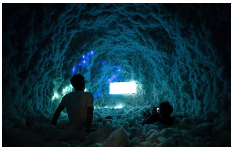
Cloudy Reflection © Camilo de Martino

Cette résidence de recherche artistique a pour but d'explorer l'intersection entre le monde physique et le numérique. Inspiré par des artistes avant-gardistes tels que Zach Lieberman, Lu Yang ou encore Ryoji Ikeda, Camilo de Martino souhaite plonger dans les complexités du creative coding , des shaders , et du développement créatif afin de développer son langage artistique. En adoptant une approche multidisciplinaire, il projette d'intégrer des éléments de jeux vidéo, d'art interactif et de sonorisation pour créer des expériences enrichissantes qui questionnent notre perception de la réalité. L'artiste présentera son travail lors des portes ouvertes de sa résidence le jeudi 28 novembre à 18 heures.