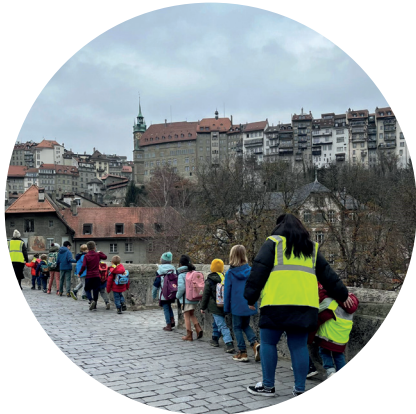
Accompagner votre enfant sur le trajet de l'école