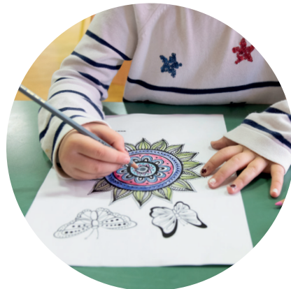
Dessiner et bricoler