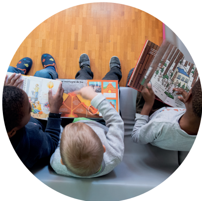
Ecouter des histoires, lire, se reposer