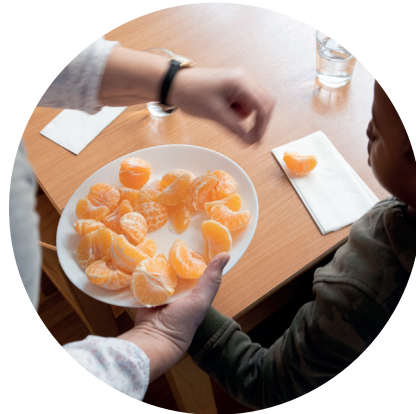
Manger un repas sain à midi et au goûter